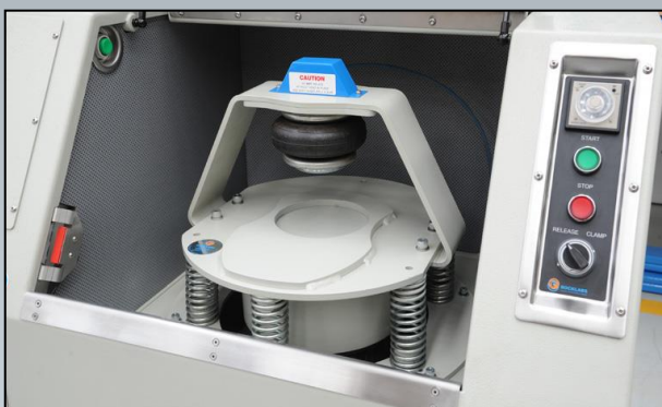
Opção com mola pneumática

* Disponível placa de adaptação, propiciando o uso de panelas de outros fornecedores *